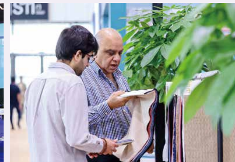
本届绍兴春季国际纺博会以“国际、时尚、绿色、高端”为主题。