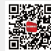
纺织服装周刊 今日头条号