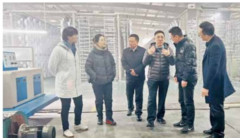
协会一行调研当地产业发展。

此次调研显示，与以往仅重视产品相比，行业大部分企业已经认识到品牌建设的重要性，并将其纳入企业近期计划和长远发展规划。还有很多企业，已经在品牌建设上取得了显著成效。企业不仅在品牌建设上采取了各类措施，还认识到品牌建设除了修炼内功，也需要积极参与地