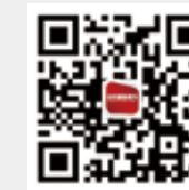
纺织服装周刊 新浪微博