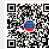
纺织服装周刊 微信视频号