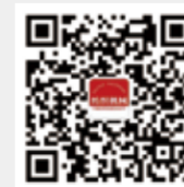
纺织机械 微信订阅号