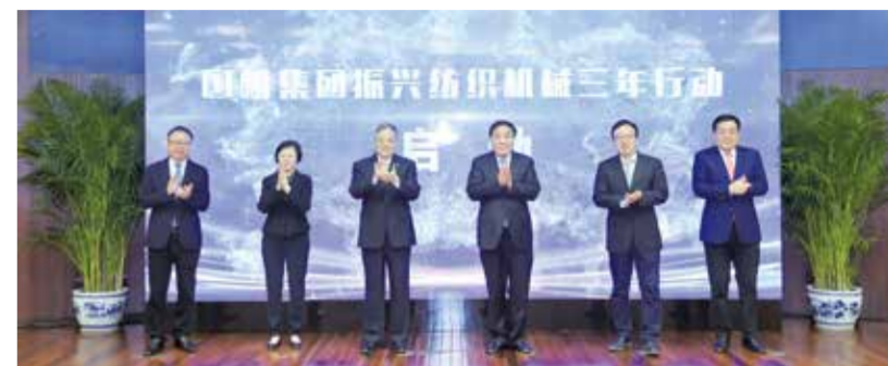
与会领导和嘉宾见证国机集团振兴纺机三年行动启动。

郝建秀在贺信中要求，开展振兴纺织机械三年行动，要认真落实习近平总书记关于装备制造业重要讲话和指示批示精神，集中优势资源攻坚克难，着力锤炼技术创新力，扩大品牌影响力，锻造核心竞争力，为