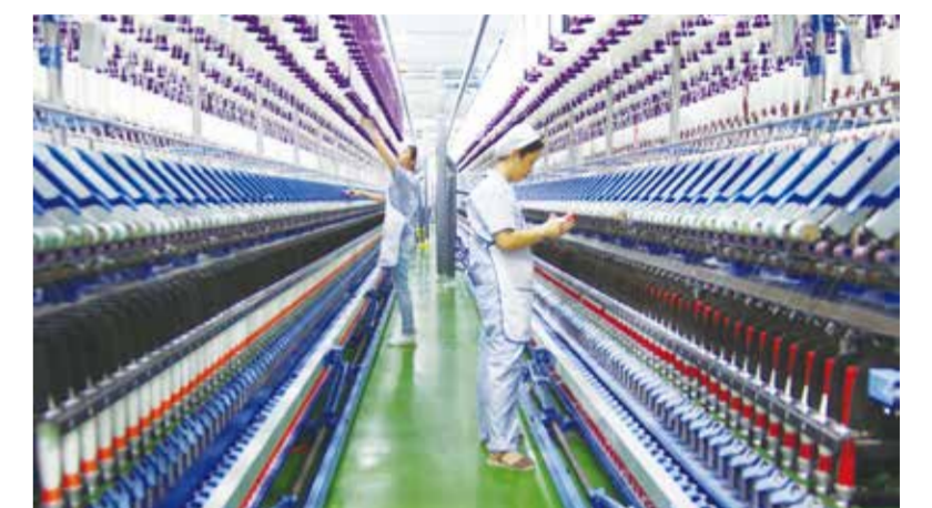
当下，纺织行业抗风险能力和发展韧性不断释放。