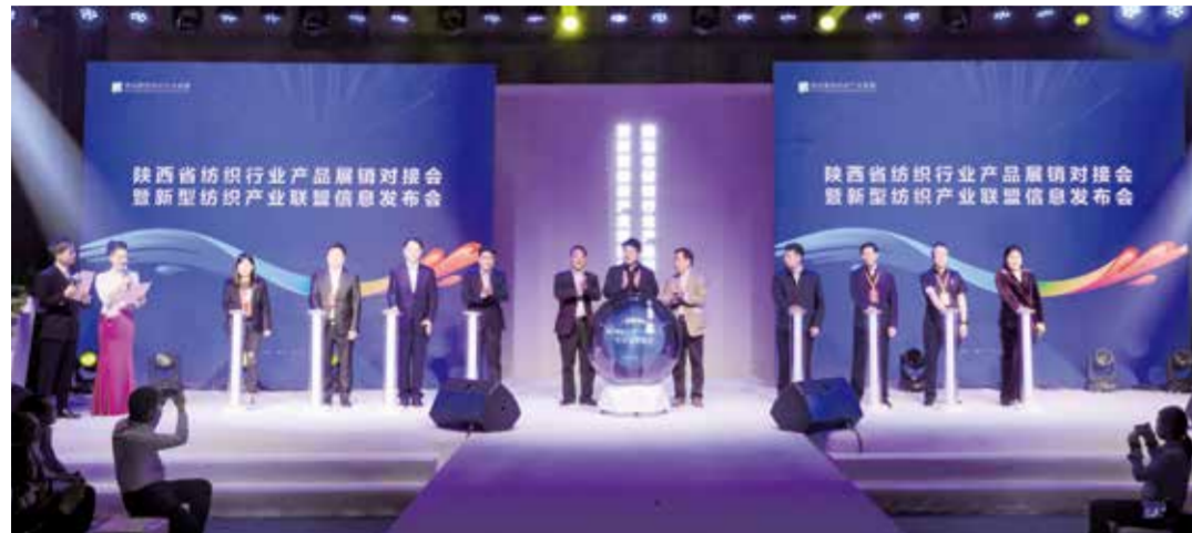
联盟致力于推动陕西纺织产业发展迈入快车道。

西安，不仅是闻名遐迩的古都，千年历史交汇于此，对纺织产业来说，西安更是为中国纺织工业的发展做出过重要贡献。