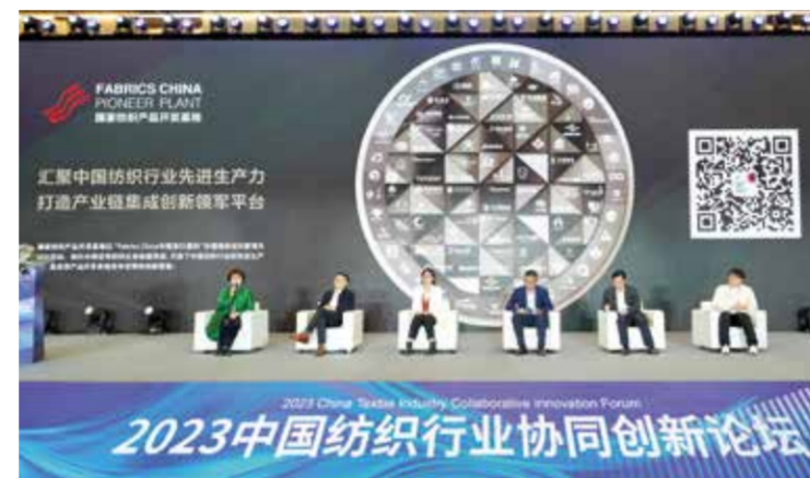
本次论坛为柯桥建设现代化“国际纺都·杭绍星城”注入了新理念。