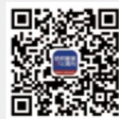
纺织服装周刊 微信订阅号