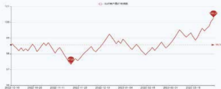
图1 盛泽市场化纤类产品价格指数

据对350家被采价单位反馈的数据监测分析,本周商务部中国·盛泽丝绸化纤指数有所上涨。其中,化纤总指数收盘于100.25点,与上周相比上涨0.64点;化纤面料价格指数有所上涨,收盘于100.05点,与上周相比上涨了0.59点;化学纤维价格指数收盘于110.33点,与上周相比上涨了0.71点。本周蚕茧丝绸类产品价格指数小幅下降,收盘于107.42点,与上周相比下降了0.18点。