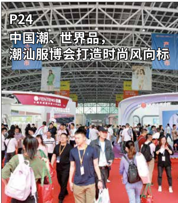
P24 中国潮、世界品， 潮汕服博会打造时尚风向标