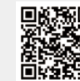
纺织服装周刊 网易号