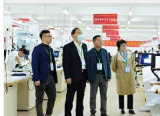
相关领导观看了技能大赛。

3月30日—4月2日,由广东省教育厅主办的2022—2023年度广东省职业院校学生技能大赛(高职组)服装设计与工艺赛项在广东职业技术学院高明校区成功举行。来自全省23所职业院校的38支代表队76名选手同台竞技,一展风采。