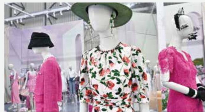
搭建商贸对接平台吸引外来资本共同参与建设是本届虎门服交会的一个目标。

公司产品以年轻消费群体为定位，在销售渠道铺建方面也以线上新零售消费为主，建立专属供应链云仓，保证产品运输的快速便捷，确保消费者可以最快收到产品。