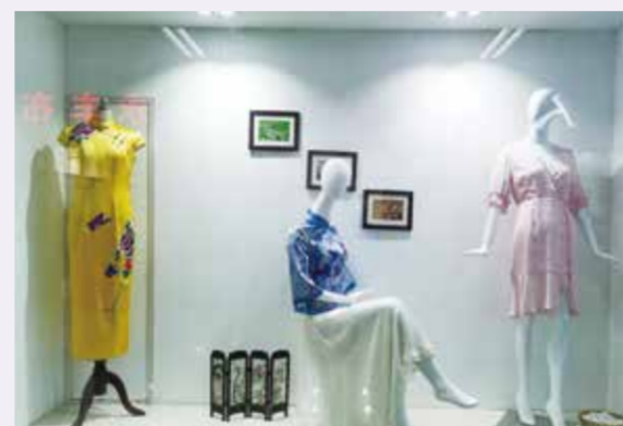
对于许多纺城布商而言，印花就是“生之趣”的纺织形式呈现，寄托了人们对美好的向往，值得倾注一生的专注与热爱。