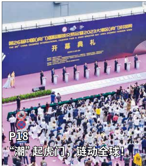
P18 “潮”起虎门，链动全球!