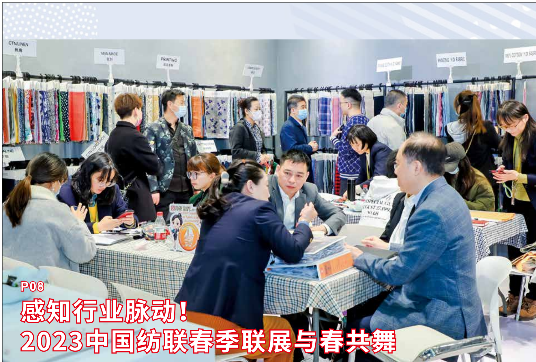
P08 感知行业脉动! 2023中国纺联春季联展与春共舞