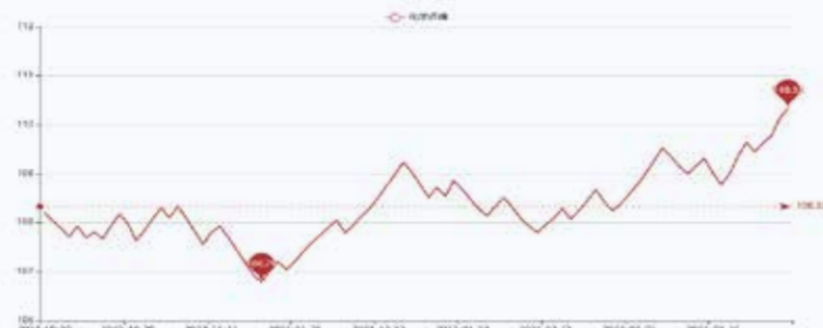
图2 盛泽市场化学纤维价格指数

本周以来,国际油价触底反弹,大幅回升。美国炼厂春季检修高峰结束,需求或有增长,叠加全球供应趋紧,国际油价上涨。截至3月30日收盘,纽约商品交易所5月交货的轻质原油期货价格上涨1.40美元,收于每桶74.37美元,涨幅为1.92%;5月交货的伦敦布伦特原油期货价格上涨0.99美元,收于每桶79.27美元,涨幅为1.26%。