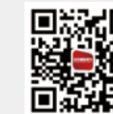
纺织服装周刊 新浪微博