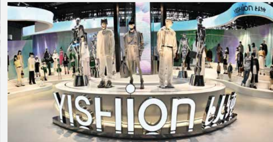
虎门以本届服交会为契机，扎实推进高质量、可持续发展，奋力书写中国式现代化的虎门篇章。