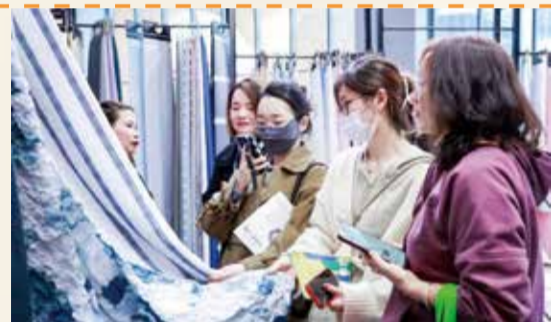
众多参展商反馈此次展会规模大、品类全，观众买家质量和数量令人赞叹。

数百场的论坛、研讨、对接、秀演等精彩活动在三天时间里同频共振，商机在展会中涌动，活力在交流中迸发。如火如荼的春季联展盛景让大家从中看到产业加速复苏后的新商机，更看到了纺织服装产业坚韧应对挑战的实力与信心！