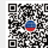
纺织服装周刊 微信视频号