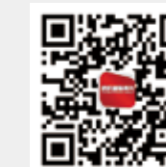
纺织服装周刊 今日头条号