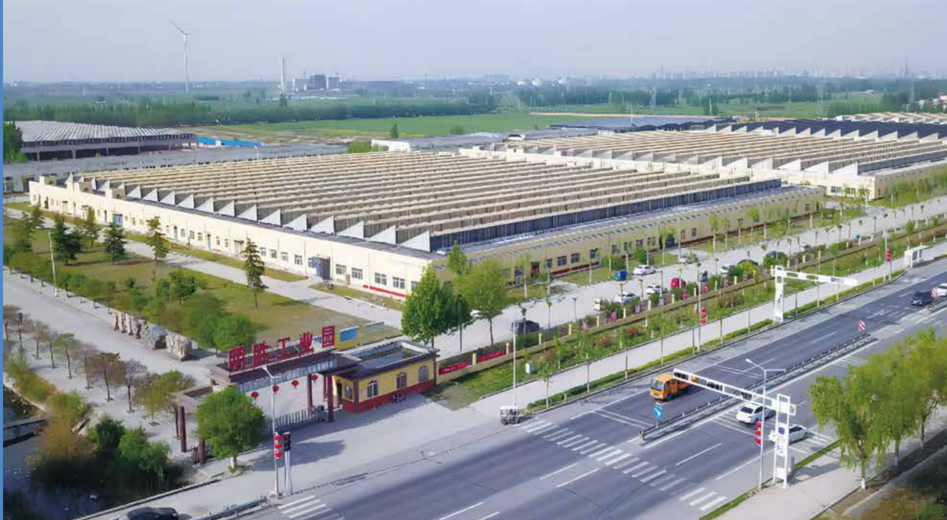
山东明胜纺织已建成纺纱、织布、印染、服装一条龙生产。