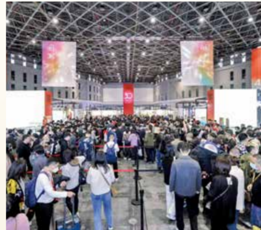
海量观众就是海量商机，主办方、商家、观众无不为此季展会拿出了最大诚意。

过来。“大家都希望来intertextile面辅料展进行采购学习，新产品新技术以及中国市场的变化，在这个大型品牌展会上全面了解最合适不过。”