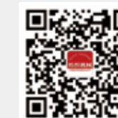
纺织机械 微信订阅号