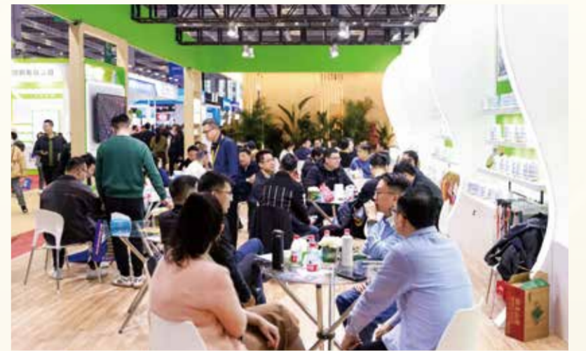
yarnexpo春夏纱线展为采购双方搭建起更加高效的供需匹配平台。

在连云港杜钟新奥神氨纶有限公司的展位上，来自下游纱线、面料、品牌等产业链各环节的合作伙伴络绎不绝。本届展会，公司不仅带来了