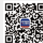
纺织服装周刊 微信订阅号