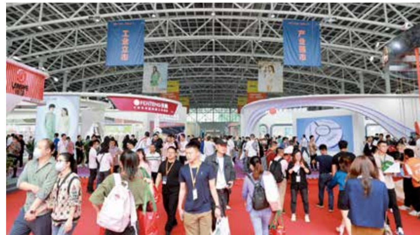
潮汕服博会致力于打造成为全国乃至全球的内衣家居服和毛衫产业的“风向标”。

2023 第二届中国·潮汕国际纺织服装博览会于 3 月 24—26 日举行。展会规模 5 万平米，分为 5 大展馆共 15 大展区，共有 508 家内衣、家居服、毛衫等纺织服装企业参展，12 个产业集群组团参展，超 10 万爆品新品群芳竞放，7 场高峰论坛、15 场大秀、30 余场品牌发布秀轮番上演，1 千多名网红达人现场助阵，诠释行业潮流新风尚，展现“国潮”风采，助力中国潮流，缔造国潮魅力。据悉，展会三天共计 5 万人莅临参观。