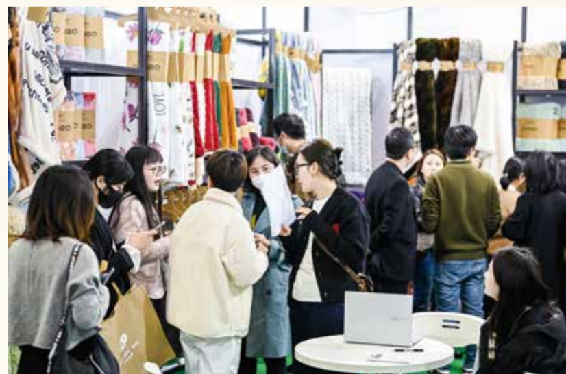
intertextile春夏家纺展发力供需两端，力求创造最大价值和利益。

不负商机，不负所期！intertextile春夏家纺展发力供需两端，力求创造最大价值和利益，加快行业元气恢复，信心复苏。展会虽已落幕，但热情并未褪去，“家纺人”怀着对未来的憧憬与干劲，正向着更高、更远的目标进发。向风而行，扬帆远航，期待8月再度相聚！