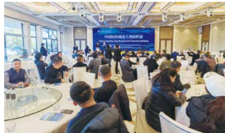
中国轻纺城意大利面料巡回展现场。

的平台，双方企业家就面料贸易、产业合作、市场拓展等议题进行了深入交流，达成了一些初步合作意向，加强了两地经贸往来，促进了中意两国的友好交流。