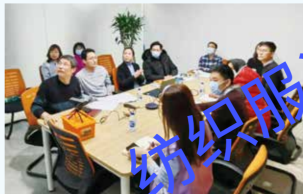
各部门人员在分会场参会。