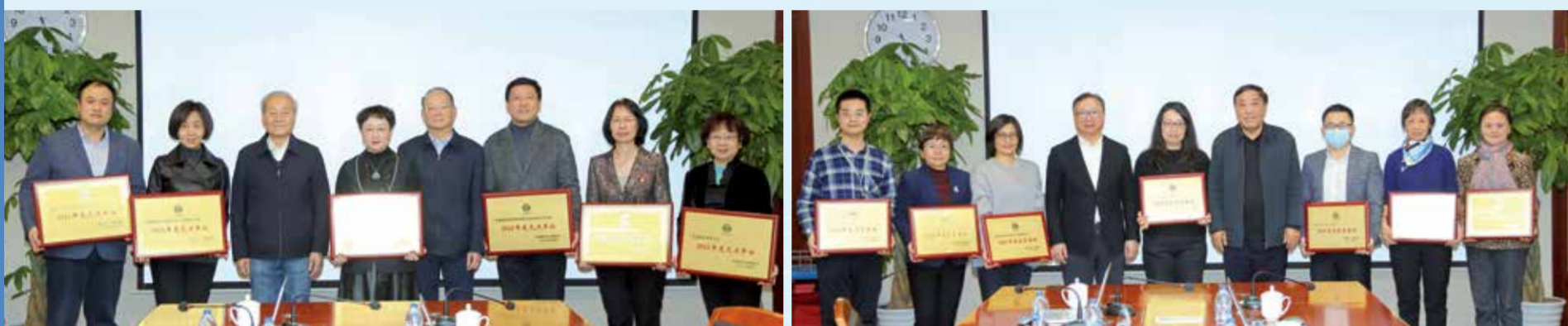
1月20—21日，中国纺织工业联合会2021年度工作总结视频会议在北京召开。