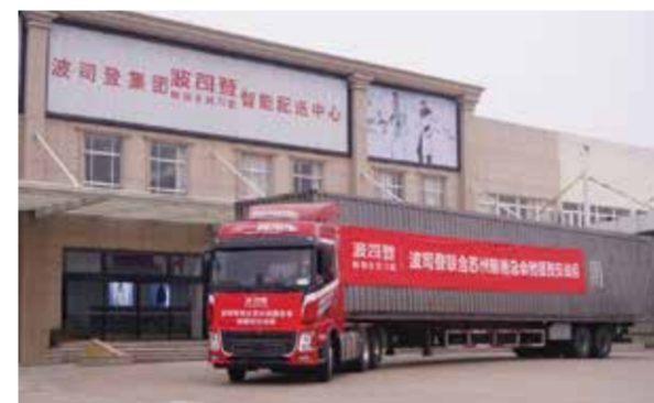
波司登向西安一线医护人员、抗疫志愿者等捐赠了2000件高品质羽绒服。

连日来,西安市的新冠疫情形势牵动着各方的关心与关注。在得知西安一线医护人员的御寒需求后,波司登公益基金会积极响应政府号召,第一时间联合苏州慈善总会发起波司登温暖行动——驰援西安,向西安一线医护人员、抗疫志愿者等捐赠2000件波司登高品质羽绒服,以实际行动践行初心使命,助力西安打赢疫情防控阻击战。据悉,相关物资已于元旦期间送达西安抗疫一线,将在陕西省慈善协会的支持下陆续下发到每一位抗疫人员的手中。