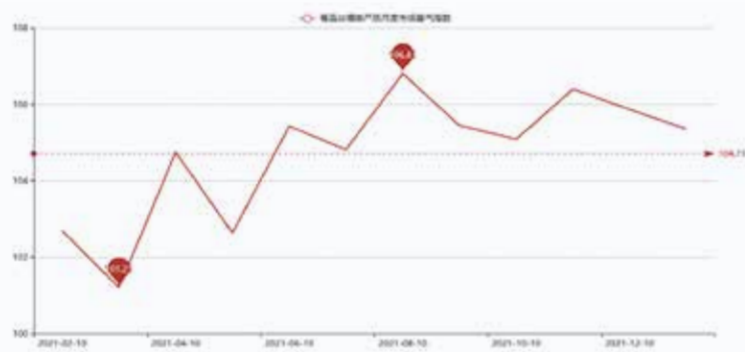
图3 盛泽丝绸类产品月度市场景气指数走势图

从蚕茧丝绸产品二级景气指标分析,2021年12月市场景气指数整体下降。其中进货成本、产品订货、产品销售价格、产品库存、盈利(亏损)变化、流动资金周转、顾客人气、资源供应等指标有所下降,其余指标上升。