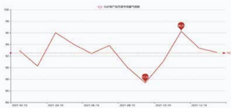
图2 盛泽化纤类产品月度市场景气指数走势图

分析可见,2021年12月总体成交气氛较11月小幅下降,大部分指标有所下降,这主要由于进入淡季延续了低迷行情,上下游产业链均出现下滑现象,原料、织造、印染等整个行业气氛回落,从而导致化纤类景气指数大幅下降。