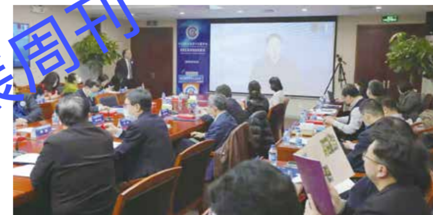
中纺圆桌论坛第十六届年会主会场。

对于2022年新发展格局下消费增长的新趋势，她分享了五个关键词：提质——衣食住行用从有向好；扩容——消费重心从商品转向服务；创