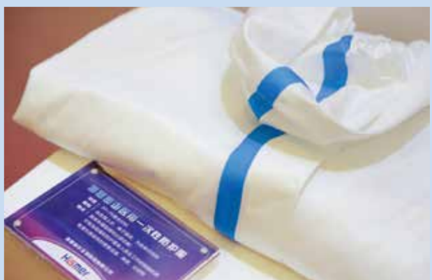
创新中心提出未来将基本实现高端医用纺织材料的自主有效供给。