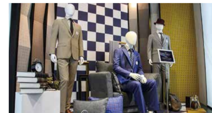
南山智尚是高端毛纺面料产业与服装定制行业的领军者。

此次波司登温暖行动驰援西安,是波司登公益的延续,又一次彰显了民族品牌的责任与担当。波司登将继续积极响应党中央号召,踔厉奋发,笃行不怠,发挥品牌力量和产业优势,援助受困弱势群体,为西安打赢疫情防控阻击战贡献力量。(陈珂)