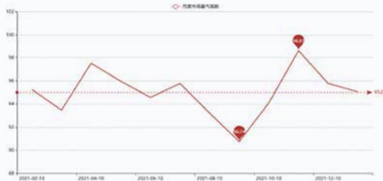
图1 盛泽月度市场景气指数走势图

分析可见,2021年12月市场景气度下降,月初延续上月的冷淡,订单量有所下降。下旬,随着原料的上涨,市场再次被带动起来,圣诞节过后,外贸订单也集中下达。