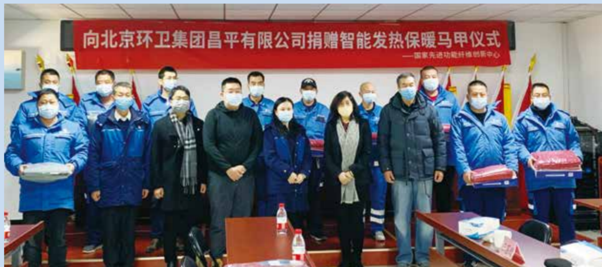
创新中心联合相关企业向北京环卫集团昌平有限公司捐赠智能发热保暖马甲。