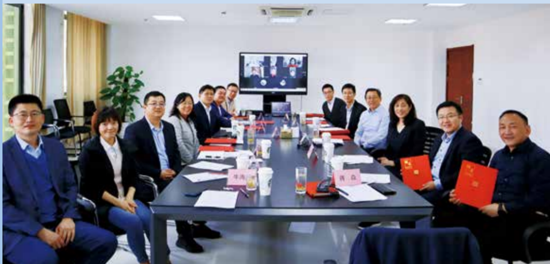
创新中心组织成立了智能纤维与制品实验室第一届学术委员会。