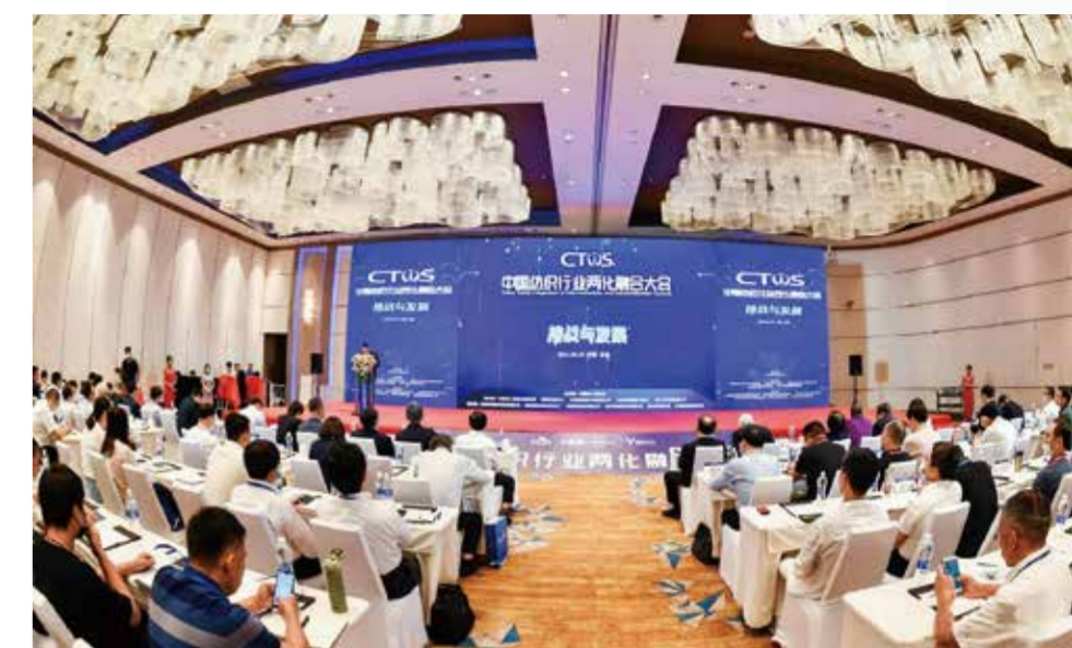
2021中国纺织行业两化融合大会现场。

互联网发展行动计划（2018-2020年）；牵头成立“中国纺织行业工业互联网联盟”；开展试点示范，遴选了一批纺织行业工业互联网平台试点示范项目；建设纺织行业工业互联网示范基地；举办会议、培训等多种推广活动；组织实施工信部工业互联网创新发展工程项目等。