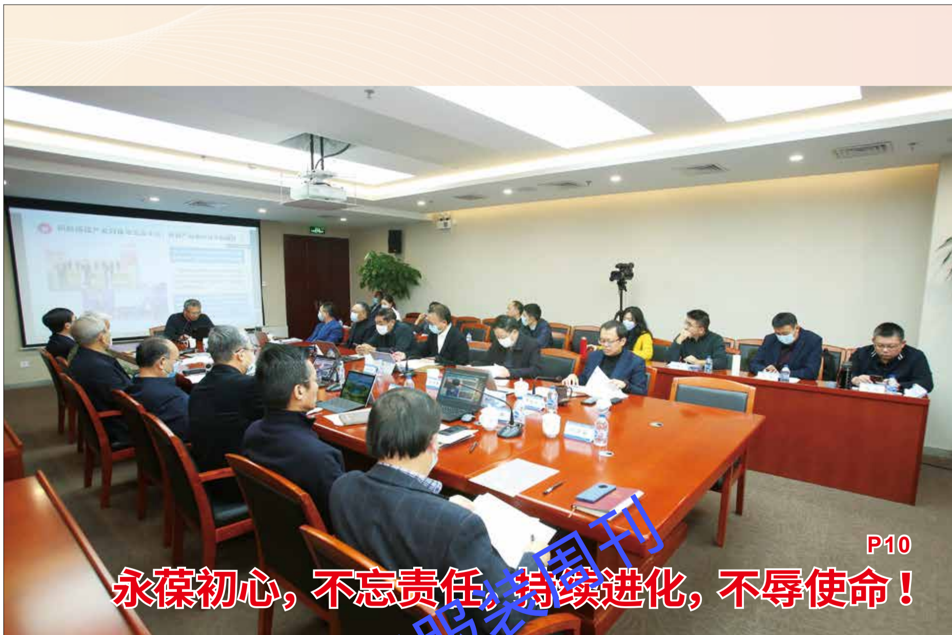
1月20-21日，中国纺织工业联合会2021年度工作总结视频大会在北京召开。