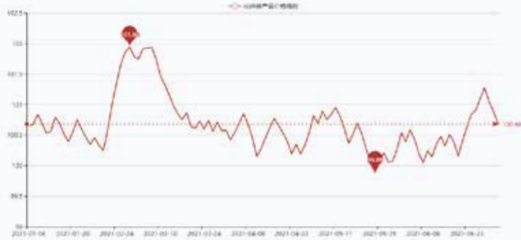
图1 盛泽市场化纤类产品价格指数

据对350家被采价单位反馈的数据监测分析,本周商务部中国·盛泽丝绸化纤指数小幅回落。其中,化纤总指数收盘于100.71点,与上周相比下跌了0.2点;化纤面料价格指数小幅下跌,收盘于99.06点,与上周相比下跌了0.18点;化学纤维价格指数小幅回落,收盘于105.65点,与上周相比下跌了0.22点。本周蚕茧丝绸类产品价格指数小幅上升,收盘于107.95点,与上周相比上涨了0.13点。