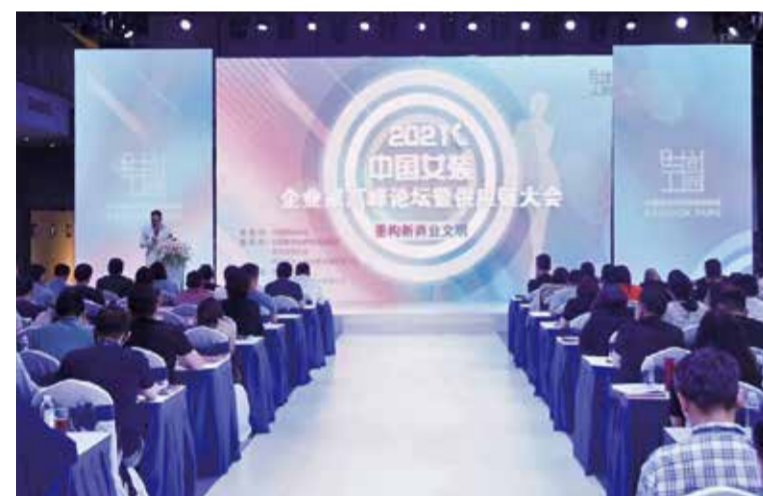
大会分享了企业创新管理理念。

6月24—25日，以“构建新商业文明”为主题的2021中国女装企业家高峰论坛暨供应链大会在时尚工园盛大举行。