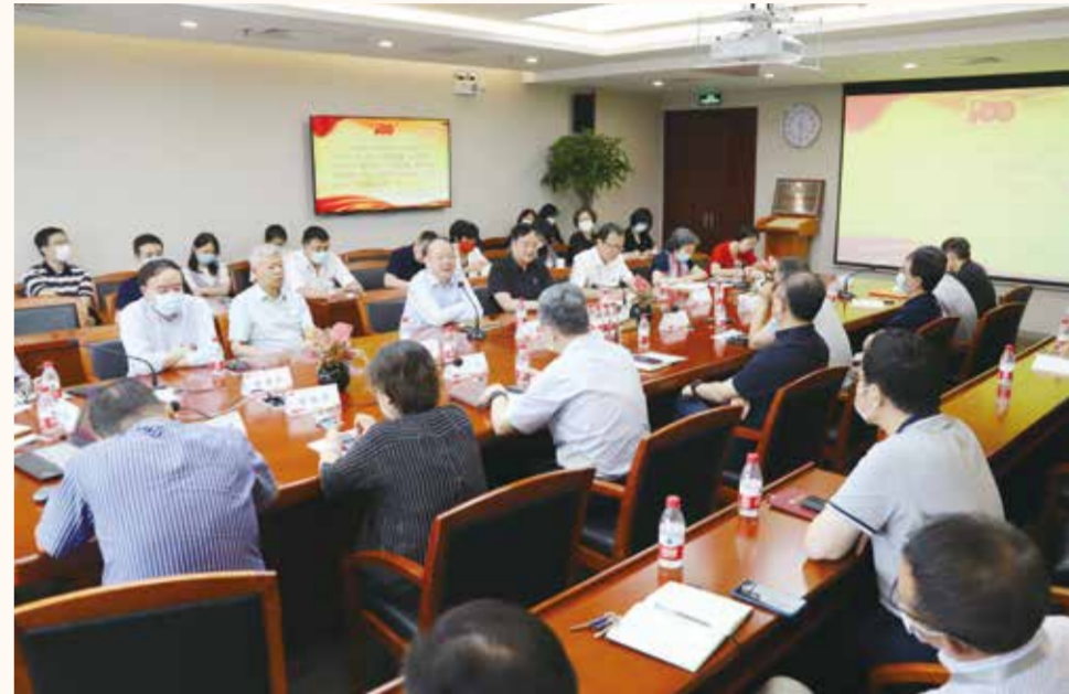
专题学习交流会现场。

时代赋予了中国纺联这样的行业组织以新的责任和使命——为行业谋发展、为社会谋和谐、为国家谋兴旺、为世界谋共荣。