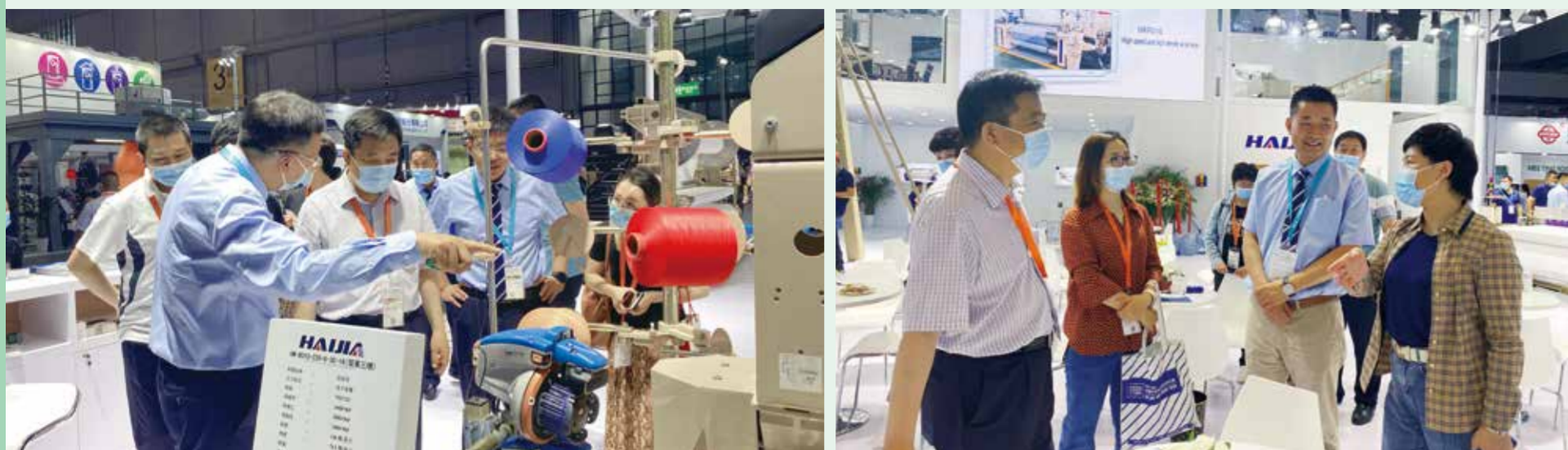
调研团队与参展商充分交流。