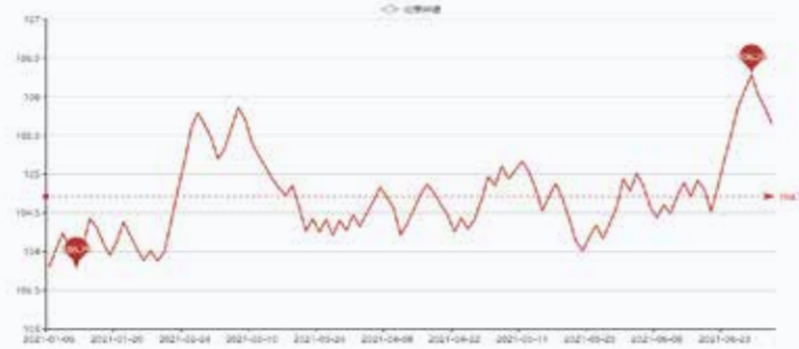
图2 盛泽市场化学纤维价格指数

月的协议。由于增产总额低于预期,这一传闻也被视为原油价格的利好因素。据悉,阿联酋目前的减产基线为2018年时最高316.8万桶/天的产能,但随着一系列扩建项目,该国产能已经提高至接近400万桶/天。与会人士表示,这种“合规加塞”增产的行为遭到了OPEC+领头羊沙特和俄罗斯的愤怒驳斥,各国将继续寻找弥合分歧的方法。由于阿联酋反对,OPEC+未能在会议上达成最终协议,国际油价冲高回落。截至7月1日收盘,WTI原油期货8月合约收于75.23美元/桶,涨幅为2.40%;布伦特原油期货9月合约收于75.84美元/桶,涨幅为1.63%。亚洲PX涨5.16至900.83美元/吨FOB韩国和919.83CFR中国。欧洲PX涨4.5至907美元/吨FOB鹿特丹。