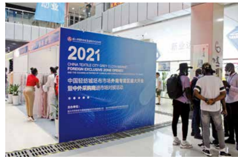
开业活动吸引众多外商。

市场将利用网络直播、云展会、云发布、云对接等有效的线上活动，持续为市场经营户做好对外宣传推介工作，同时鼓励并协助经营户积极拥抱新模式、新业态，借助网上轻纺城等相关电子商务平台，开通网上黄页和网上商铺，把实体市场和线上市场有效结合，助力市场赢