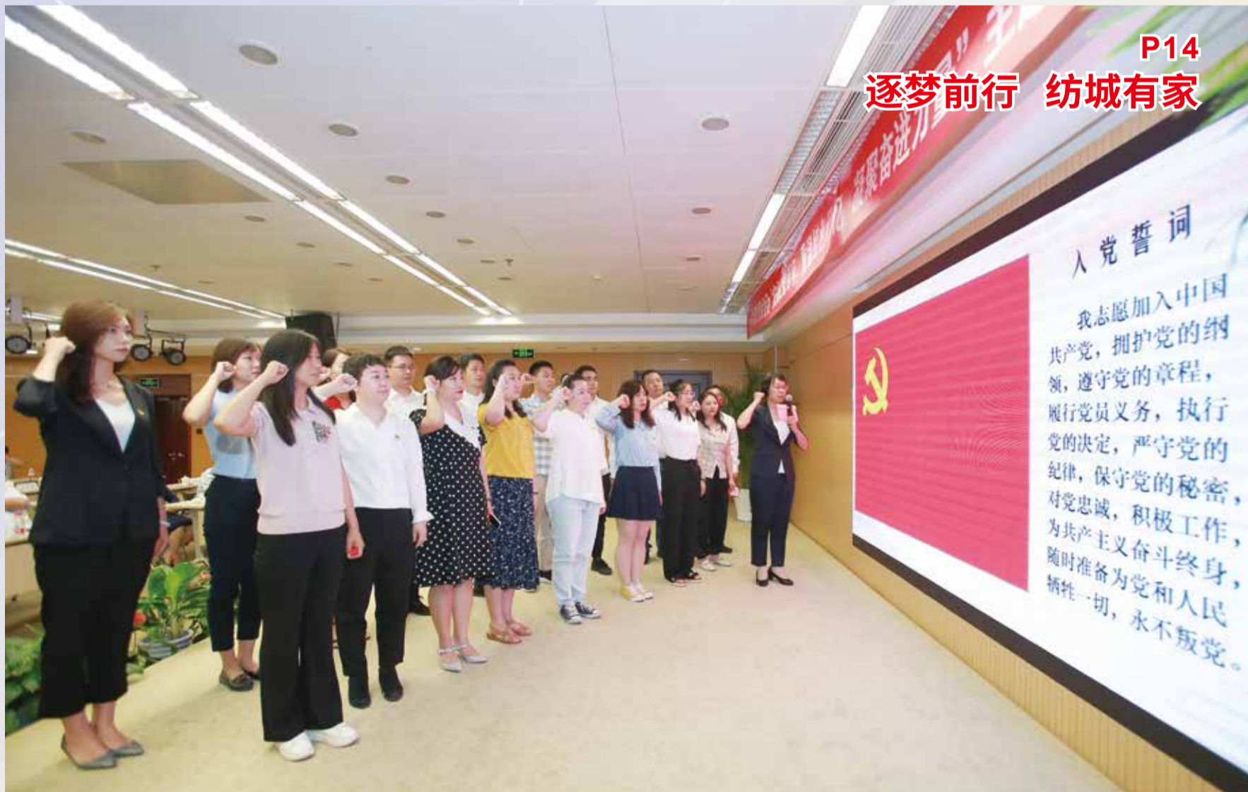
6月29日,在中国纺织工业联合会党委举行的庆祝建党百年主题党日活动中,新党员进行了入党宣誓。