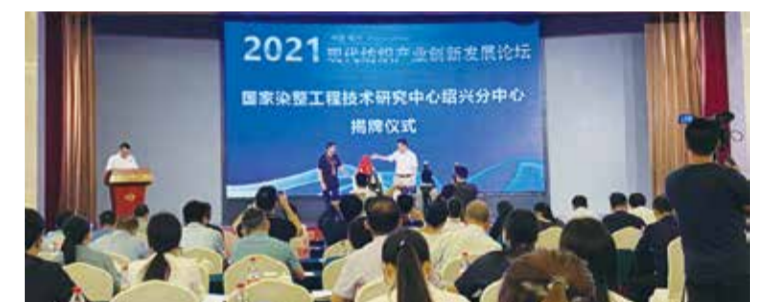
创新发展论坛为企业注入新活力。

本次专题歌会作为中国轻纺城开展党史学习教育的一项重要内容，不仅大力营造了庆祝建党100周年的浓厚氛围，讴歌了中华民族实现伟大复兴的奋斗历程，也激发了中国轻纺城全体党组织和党员积极投身打造新时期“国际纺织之都”，领跑全市做标兵、竞跑全省做贡献，为中国轻纺城“十四五”发展起好步开好局的工作激情。