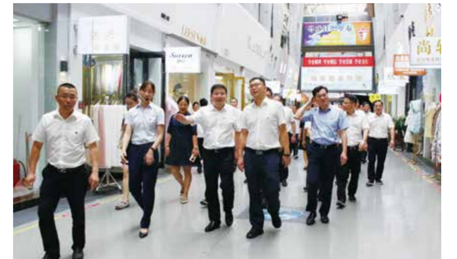
柯桥领导一行考察中国轻纺城东市场。

今年，在建党100周年之际，中国轻纺城将学党史和市场实际情况相结合，紧扣忠实践行“八八战略”、奋力打造“重要窗口”主题主线，向着