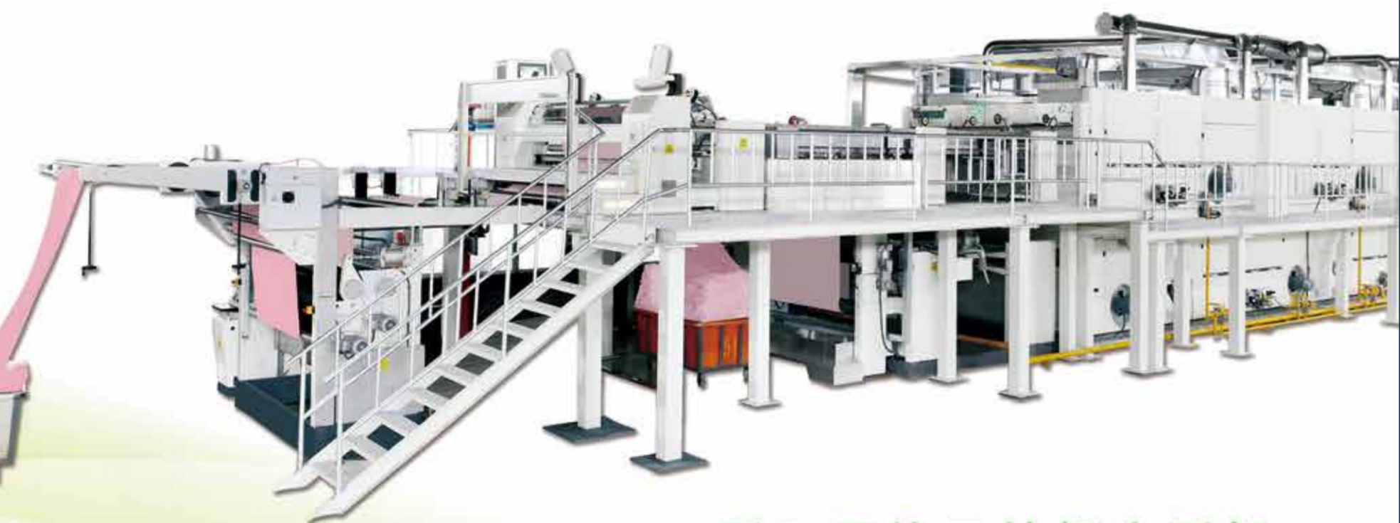
Y9000型双层热风拉幅定形机