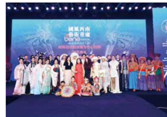
时尚盛典呈现了一场文化艺术视觉盛宴。

为了让设计从业者提高版权意识，优化版权保护环境，本次活动进行了重庆时尚设计版权服务中心授牌，市级版权服务中心正式落户渝北。为更好地彰显西南少数民族特色文化和原创时尚魅力，活动现场还演绎了一场西南风情的现代时尚大秀。此外，还举办了“中国西南时尚设计(国潮、非遗)纹样艺术作品展、时尚设计版权对接会、‘国风西南纹样艺术的传承、创新与转换’主题论坛等。(赵国玲)