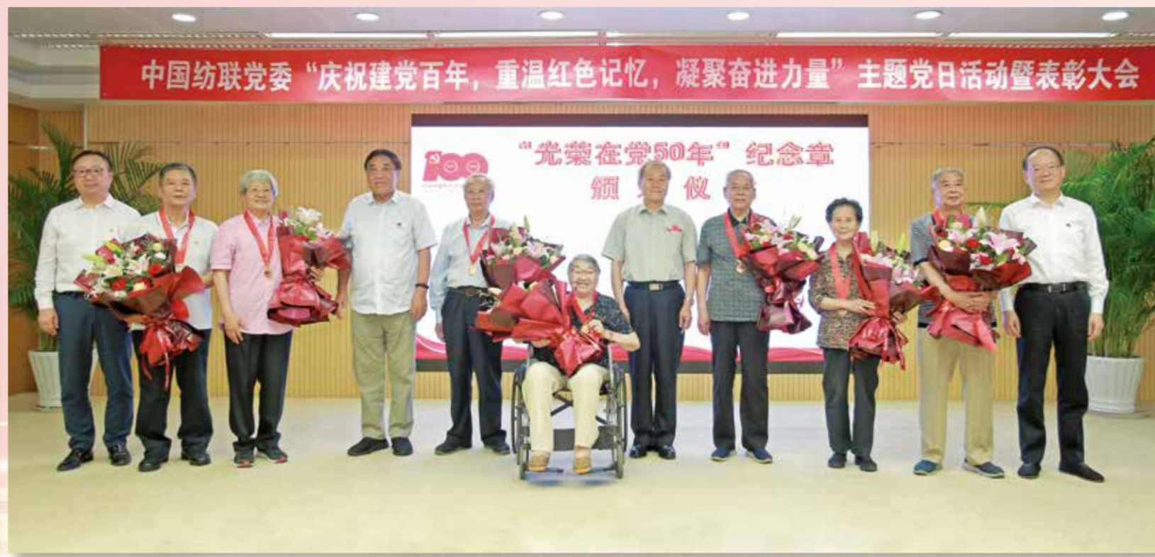
中国纺联党委举办了丰富多彩的主题党日活动。