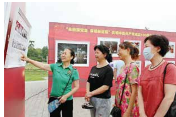
摄影展分5个篇章共展出120幅精品力作。

会议期间，时尚工园还举办了法国ESMOD毕业大秀与作品展，以及宸帆集团、朗浩集团、维格娜丝、素泊电商、上海和兆、南京圣可尼、鹿颜国际和赢家时尚集团品牌专场对接会。(董笑妍)