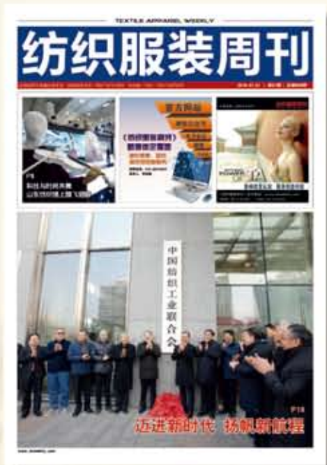
中国纺织工业联合会会刊