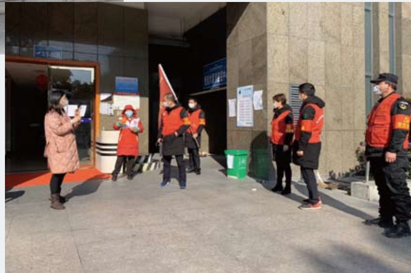
纺城党员经营户积极深入抗疫一线，构建群防群治严密防线。