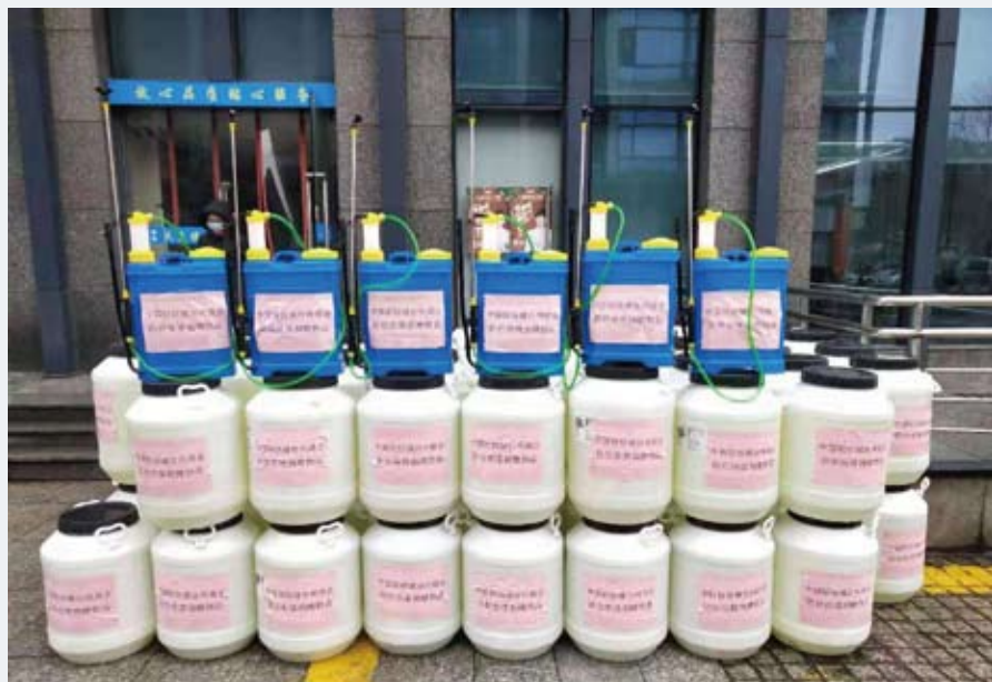
台州商会为一线防疫部门捐献物资。