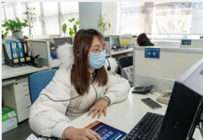
网上轻纺城为中国轻纺城实体市场的复业做好全面支持工作。

目前，疫情阻击战仍在进行中，纺织服装专业市场作为客流较大的经营场所，是防范疫情的重中之重。在这样的大环境下，柯桥区政府坚持“一手抓疫情防控、一手抓复工复产”的思路，统筹推进企业复工、市场复业。