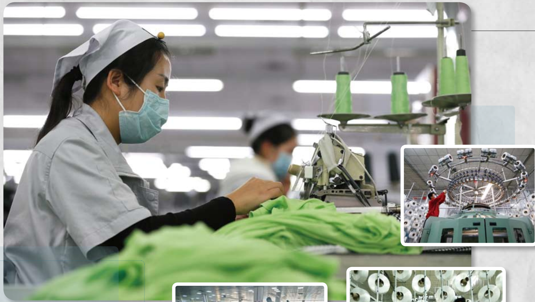
2月14日，在位于山东青岛市即墨区的青岛即发集团有限公司生产车间里，工人在制作出口到海外的服装产品。