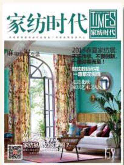
中国家用纺织品行业协会会刊