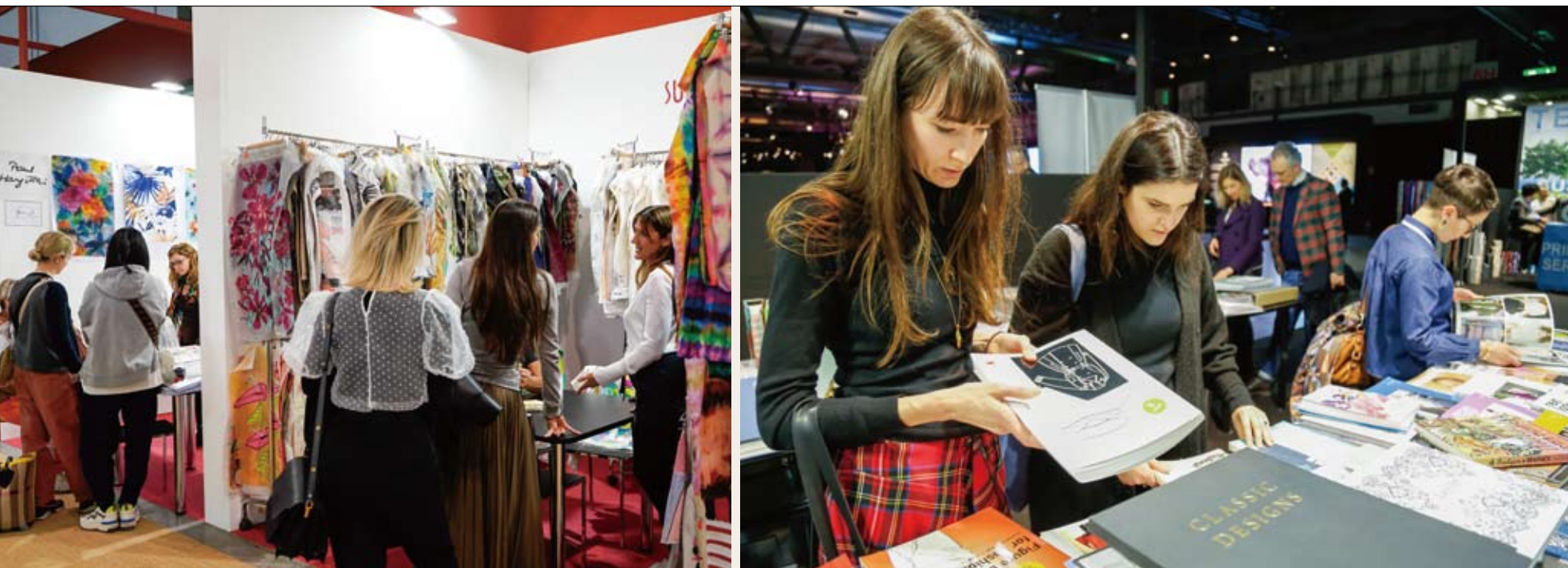
本届展会展示了2021年春夏季服装高档面料和辅料。