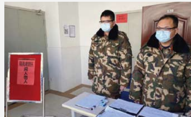
盛虹集团斗志高昂确保生产。