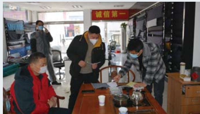
市场严把防疫关，与经营户共战疫情、共渡难关。

连日来，中国东方丝绸市场还施行了“一免两减半”优惠政策，有力有序推动市场复市。孙健华告诉记者：“我们积极出台和贯彻落实相应的政策支持，要求对承租国有资产类经营用房的经营户实施‘一免两减半’政策，即1个月房租免收、2个月房租减半；建议集体业主、鼓励私营业主为租户相应减免租金，共战疫情、共渡难关。”