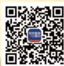
纺织服装周刊微信