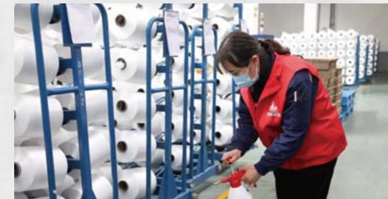
创新中心成员新风鸣集团发挥党员先锋模范作用，为生产筑起一道红色的“防疫墙”。

服务政府制定专项政策： 准确掌握行业开工、生产、库存、需求、资金、用工等实际情况，加强未来趋势研判，提出政策建议，并及时将信息反馈给国家有关部门，供决策参考。