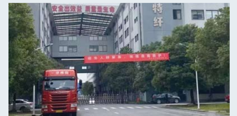
京奕集团正全力以赴组织生产，力争在最短时间内满足市场供应。