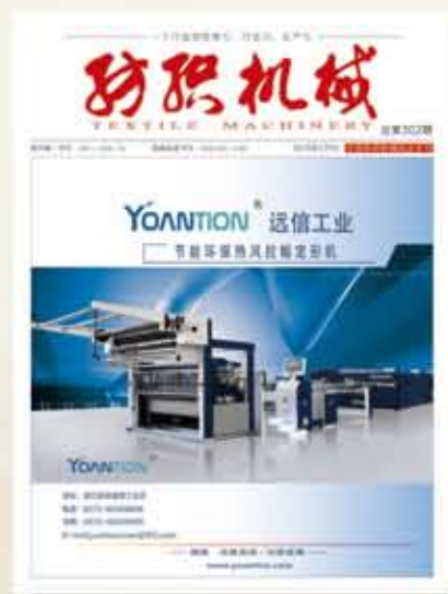
中国纺织机械协会会刊