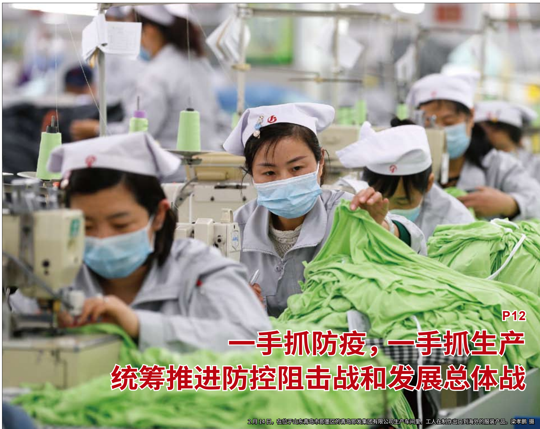
2月14日，在位于山东青岛市即墨区的青岛即墨集团有限公司生产车间里，工人在制作出口到海外的服装产品。梁孝鹏 摄