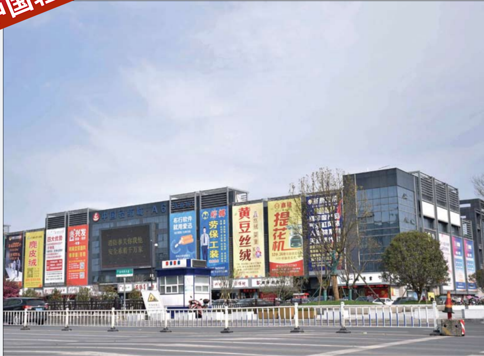
政企同心，纺城柯桥积极采取行动，助力打赢疫情阻击战。

打造新时期 国际纺织之都 欢迎关注柯桥中国轻纺城官方微信平台，您将获取更多资讯。