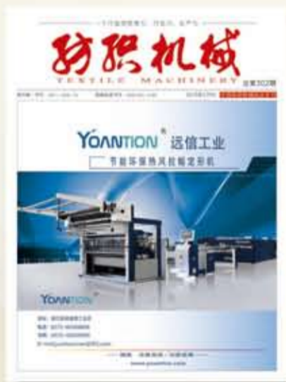
中国纺织机械协会会刊