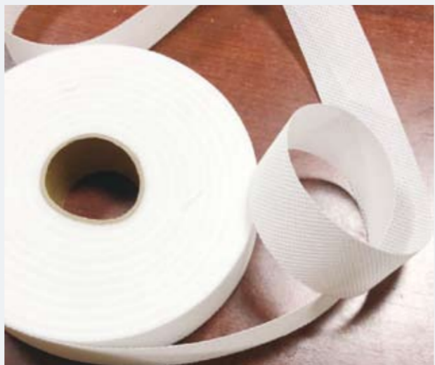
柯桥相关防护面料制造企业助力生产防控物资，投身疫情防控阻击战。