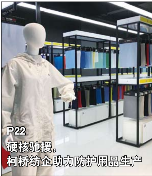
P22 硬核驰援， 柯桥纺企助力防护用品生产