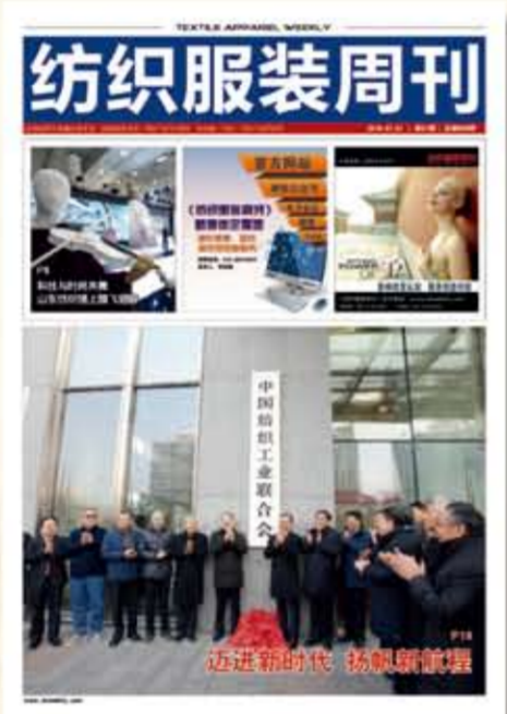
中国纺织工业联合会会刊