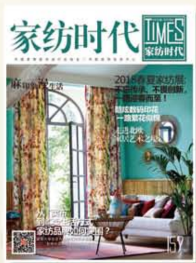
中国家用纺织品行业协会会刊